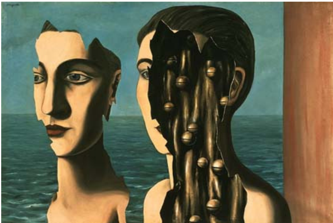
René Magritte, Le double secret (1927)

Reimpressão preparada por Osvaldo Pessoa Jr. para a disciplina TCFC III – Filosofia das Ciências Neurais, FFLCH-USP, São Paulo, 2014. A paginação da versão original está indicada no texto, entre colchetes.