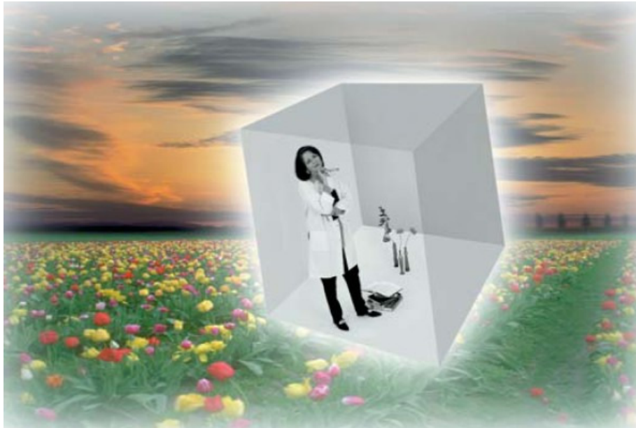
[Figura 1] Uma neurocientista isolada em uma sala preta e branca sabe tudo sobre como o cérebro processa as cores, mas não sabe como é vê-las. Essa situação sugere que o conhecimento do cérebro não fornece um conhecimento completo da experiência consciente.

Não nego que a consciência tenha origem no cérebro. Sabemos, por exemplo, que a experiência subjetiva da visão está intimamente ligada a processos no córtex visual [Fig. 2]. Mas é exatamente esta ligação que nos deixa perplexos. Notavelmente, a experiência subjetiva parece emergir de um processo físico. Mas não fazemos a mínima ideia do como ou do porquê disto ser assim.