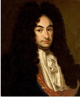
“Retrato de G.W. von Leibniz” (1703), por Andreas Scheits, Biblioteca Pública de Hannover.