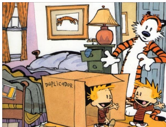
Figura II.1. A invenção de Calvin e Haroldo.

Eis então o arranjo do experimento mental. A primeira pergunta a ser feita é se Calvin-2 teria consciência, ou se ele seria apenas um “zumbi”, agindo por automatismos mas sem um vivência subjetiva. Materialistas diriam que ele é consciente, já que a consciência seria fruto apenas da matéria, ao passo que espiritualistas ou “dualistas de substância” (como Descartes) afirmariam que algo mais seria necessário para Calvin-2 ter uma alma, mente ou consciência.